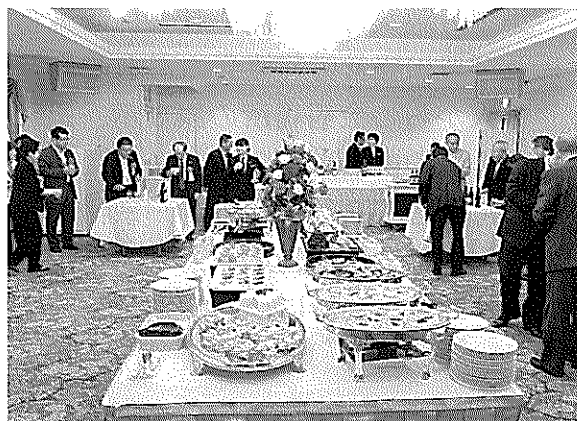
(第11回通常総代会懇親会)