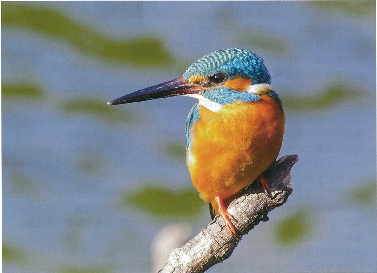
東浦町・カワセミ

http://www.aihoren.server-shared.com/ E-mail: aichi.23@abeam.ocn.ne.jp